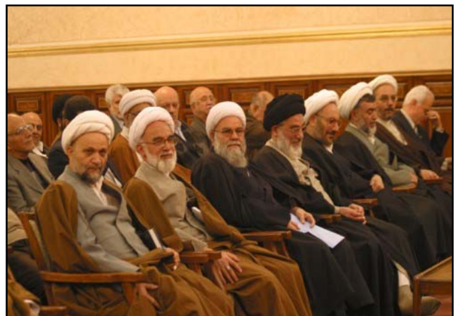
مسئولان قوه قضائیه و دیوان عالی کشور از چپ به راست: عباسعلی علیزاده- قربانعلی دری نجف آبادی- حسین مفید- محمودهاشمی شاهرودی- علی یونسی- حسینعلی نیری- اسماعیل شوشتری