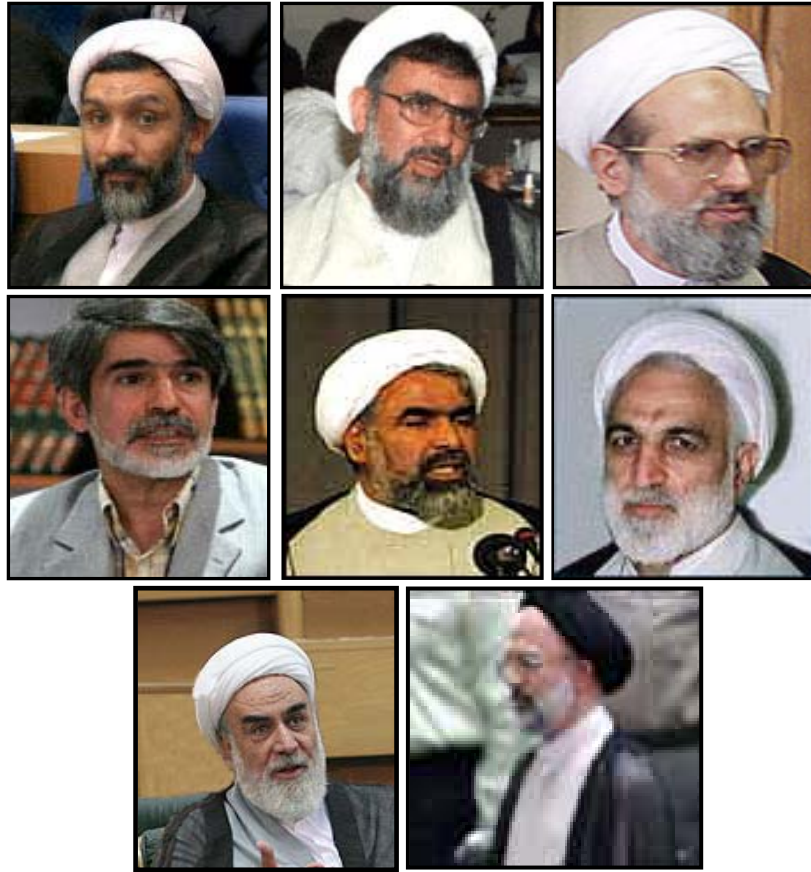
از راست به چپ: ردیف اول، محمد محمدی ری شهری (وزیر) - علی فلاحیان (قائم مقام) - مصطفی پورمحمدی ردیف دوم: غلامحسین محسنی اژه‌ای - روح‌الله حسینیان - احمدپورنجاتی ردیف سوم: علی اصغر حجازی و غلامحسین محمدی گلپایگانی