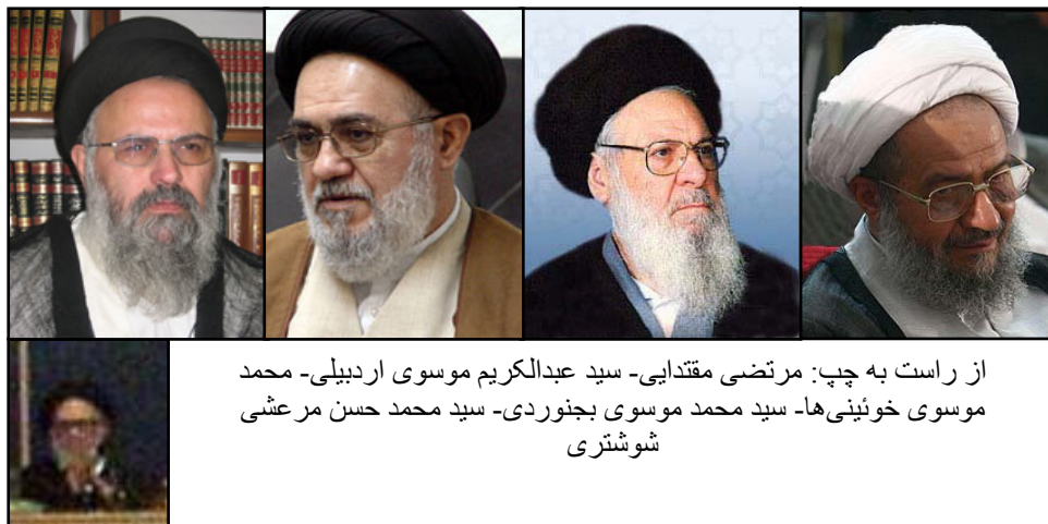
از راست به چپ: مرتضی مقتدایی - سید عبدالکریم موسوی اردبیلی - محمد موسوی خوئینی‌ها - سید محمد موسوی بجنوردی - سید محمد حسن مرعشی شوشتری