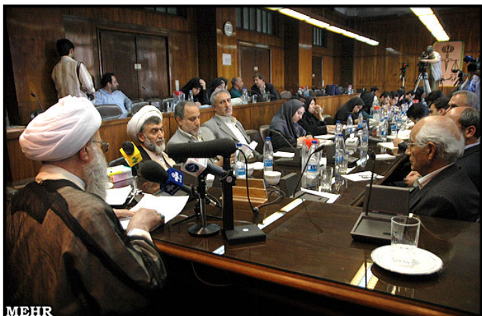
مصاحبه مطبوعاتی حسین مفید رییس دیوان عالی کشور نفر اول از سمت چپ حسینعلی نیری معاون قضایی دیوان عالی کشور