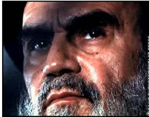
روح الله خمینی و سید احمد خمینی

روح الله خمینی به عنوان صادر کننده فرمان قتل عام و احمد خمینی به عنوان نویسنده متن حکم قتل عام و پیگیری کننده اجرای آن، نقش اساسی در این کشتار بزرگ داشتند. فرمان خمینی برای قتل عام زندانیان مجاهد در شش مردادماه ۶۷ صادر شده است. در شهریور ۱۳۶۷ حکم جدیدی برای قتل عام زندانیان مارکسیست صادر شد که متأسفانه تاکنون متن آن انتشار نیافته است و مشخص نیست حکم شفاهی بوده یا کتبی. متن فرمان خمینی برای قتل عام زندانیان مجاهد به شرح زیر است: